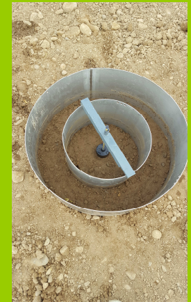
Disposition sur site